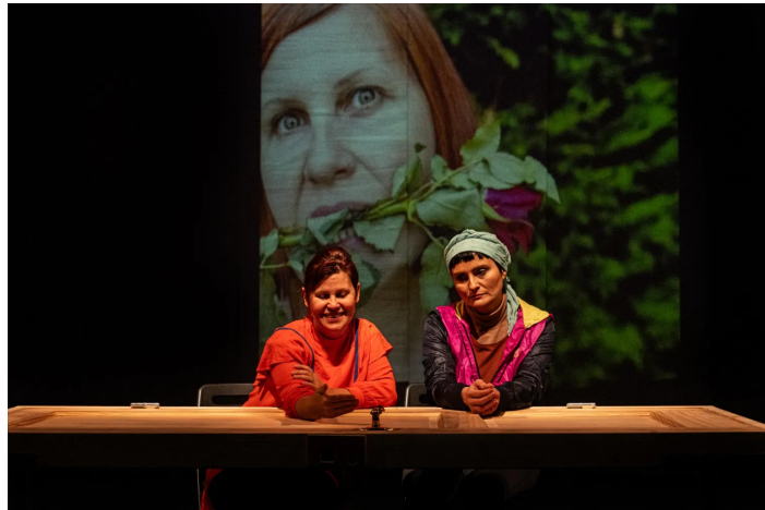
De obstakels voor nieuwkomers zijn complexer dan taal- en technische kennis: het gaat over de erkenning van kwalificaties, onzichtbare vooroordelen en het doorprikken van de ons-kent-ons-mentaliteit.

Vacatures pakken nochtans graag uit met hoe progressief en inclusief het bedrijf is. Die ronkende taal verhuult een paradox: bedrijven willen migranten als sympathieke decorstukken op de groepsfoto, maar kiezen in de praktijk voor uniformiteit. Ook binnen overheidsorganisaties vonden onderzoekers van de VUB grote verschillen tussen herkomstgroepen , al dan niet intersectioneel met geslacht, in de selectieprocedures. De onderzoekers noteerden "zelfs gevallen van discriminerende uitspraken en microagressie" die niet stroken met "het imago van de Vlaamse overheid, die tevens een voorbeeldfunctie heeft".