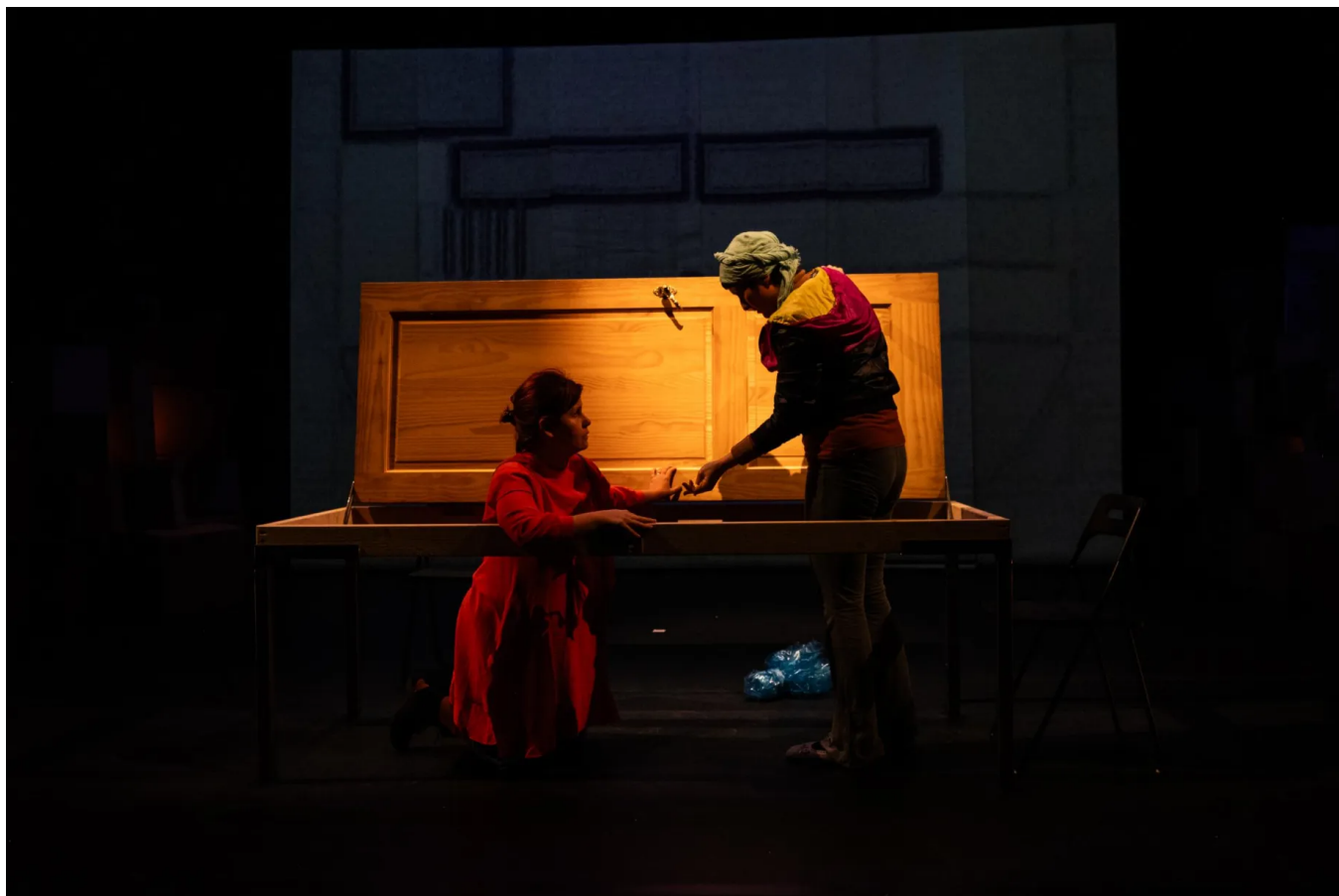
In vergelijking met andere Oeso-landen vallen vooral vrouwelijke migranten van buiten de Europese Unie in Vlaanderen uit de boot.